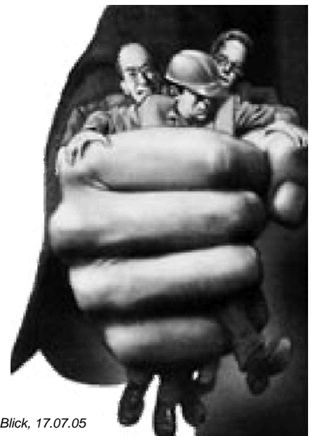
Zeichnung SonntagsBlick, 17.07.05